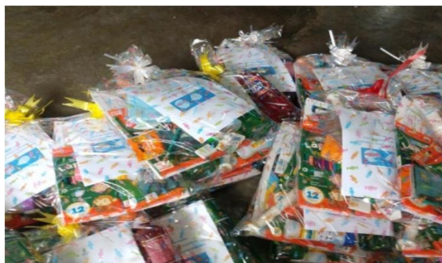
Figura 1: Kits distribuídos no Projeto Bolhas de Sabão