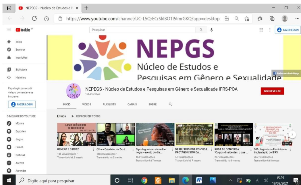
Figura 8: Ciclo de Estudos – eventos disponibilizados no canal do NEPGS/IFRS/POA no Youtube

temáticas, foi organizado o Ciclo de Estudos sobre Diversidade e Inclusão (Edição 2020) buscando promover a articulação entre pesquisadores e pesquisadoras, estudantes, integrantes de movimentos sociais e demais pessoas interessadas em aprofundar os estudos e/ou desenvolver ações em parceria em temáticas sobre gênero, sexualidade, raça e suas interseccionalidades. O Ciclo foi realizado numa parceria entre os núcleos de ações afirmativas do IFRS-Campus Porto Alegre e outras entidades e grupos de pesquisa, contando com encontros mensais, realizados de forma remota no período de julho a dezembro/2020. Os registros de tais eventos estão disponibilizados no canal do NEPGS/POA no youtube: < https://www.youtube.com/channel/UC-L5QrECrSkIBO1I5ImrGKQ >.