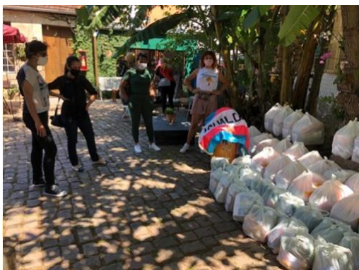
Figuras 5 e 6: Parceria entre NEPGS, TRANSENUM E IGUALDADE no atendimento da população LGBTI+