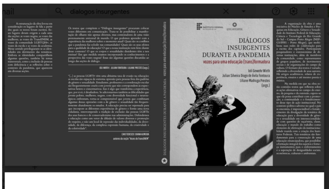
Figura 7: Capa da obra produzida organizada pelo NEPGS/IFRS/POA